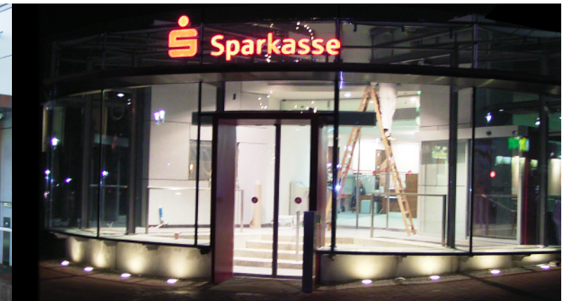
Beleuchtung durch den Glasboden