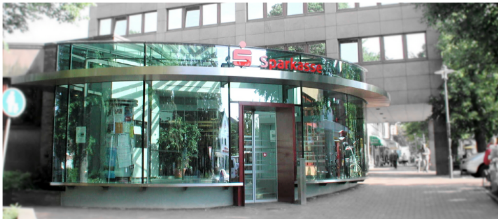
Eingangshalle nach Umbau