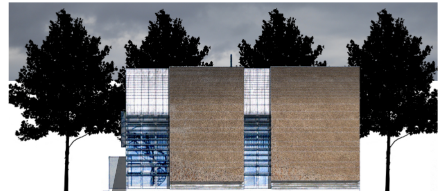
Ansicht Traufseite (Westen)