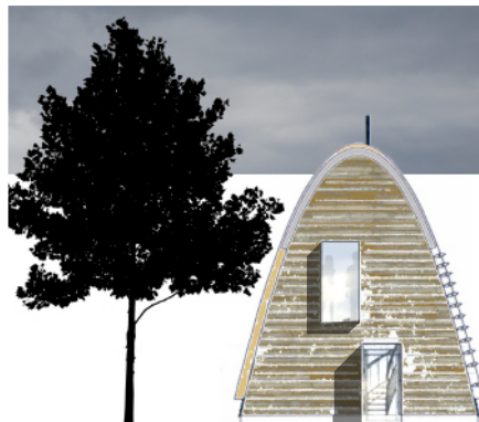
Ansicht Eingangsseite M 1:250