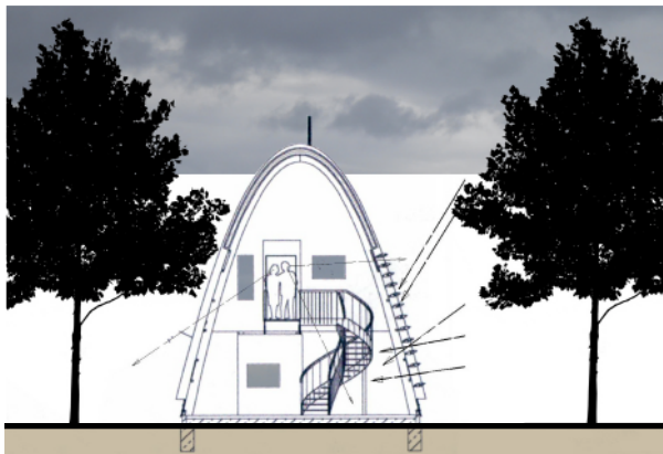
Querschnitt M 1:250